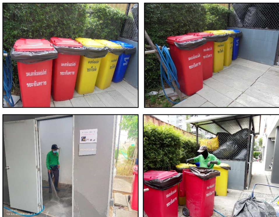
รูปที่ 1-6 ห้องขยะมูลฝอยรวมภายในโครงการ