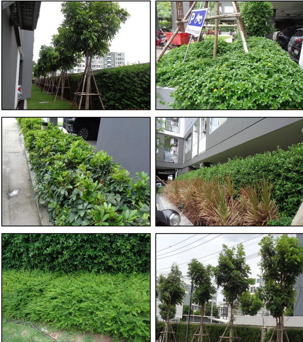
รูปที่ 1-8 พื้นที่สีเขียวในโครงการ