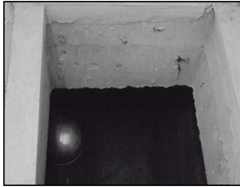
รูปที่ 1-2 ถังน้ำเก็บใช้ที่ดิน