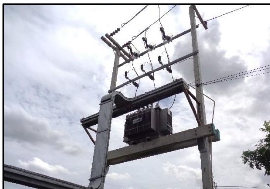
รูปที่ 1-7 หม้อแปลงไฟฟ้าภายในโครงการ

ทั้งนี้ เพื่อป้องกันอุบัติเหตุเพลิงไหม้ โครงการได้ติดตั้งระบบป้องกันไฟฟาลัดวงจรและระบบป้องกันไฟเกินปริมาณที่กำหนดแบบตัดวงจรอัตโนมัติไว้กับระบบไฟฟ้าภายในอาคารด้วย