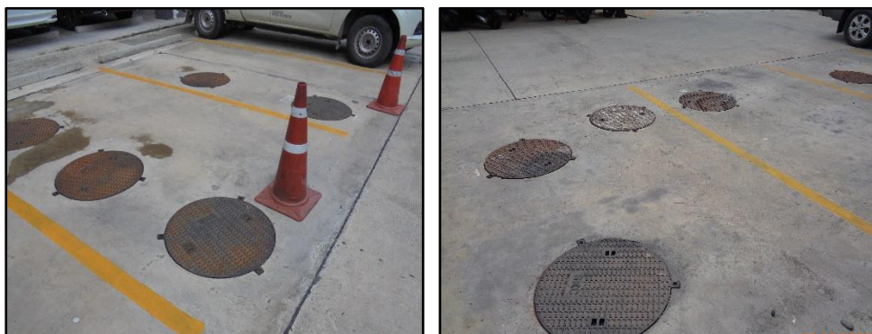
รูปที่ 1-4 ระบบบำบัดน้ำเสียภายในโครงการ

น้ำเสียที่เกิดจากกิจกรรมต่างๆ ของโครงการนั้น จะถูกรวบรวมผ่านท่อต่างๆ เข้าสู่หน่วยบำบัดขั้นต้นของแต่ละอาคาร ประกอบด้วย บ่อตกไขมัน และบ่อเกรอะ จากนั้นจะระบายเข้าสู่หน่วยบำบัดขั้นที่สองเป็นระบบบำบัดน้ำเสียแบบเติมอากาศชนิดตะกอนเร่ง (Activated Sludge; AS) จำนวน 1 ชุด ตั้งอยู่บริเวณชั้นใต้ดินของอาคาร A ของโครงการได้รับการออกแบบให้เป็นคอนกรีตเสริมเหล็กแสดงดังรูปที่ 1-4