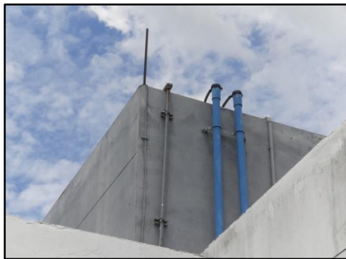
รูปที่ 1-3 ถังเก็บน้ำใช้บนดาดฟ้า